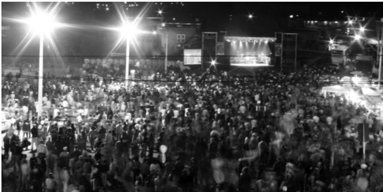
Festa de aniversário da cidade faz moradores de Santana do Paraíso saírem de casa para ver a fogueira e participarem das comemorações