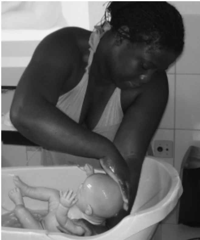
Gestante participa de capacitação em posto de saúde

Por Juana Maria de Miranda, enfermeira e especialista em Saúde da Família